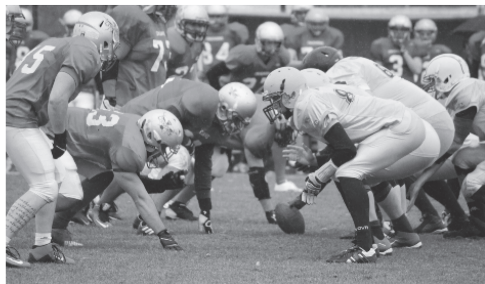
A marosvásárhelyiek megpróbálták minél több nehézség elé állítani a piros mezű kolozsváriakat.

Azt azonban mindenképpen el kell mondani, hogy minden évben egyre szorosabb meccseket játszanak a Szörnyek a sokszoros bajnok, tavalyi ezüstérmes kolozsváriakkal, és az idén az a terv, hogy a csapat legalább két ellenfelét legyőzze az alapszakaszban, hogy bejusson a legjobb négy közé és elődöntőt játszasson.