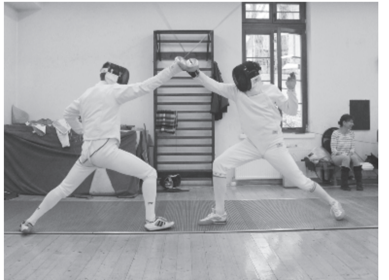
A viadalt ezúttal nem a Pongrácz Antaltól elnevezett egyetemi csarnokban, hanem a vívó-edzőteremben rendezték.